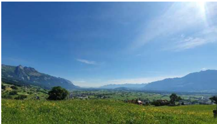
Rheintal – hinauf zum Grabserberg – weiter nach Toggenburg