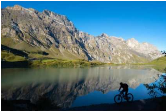
Biken im Engelbergertal

Kurvenreiche Trails durch unsere herrliche Bergwelt werden Sie bestimmt begeistern.