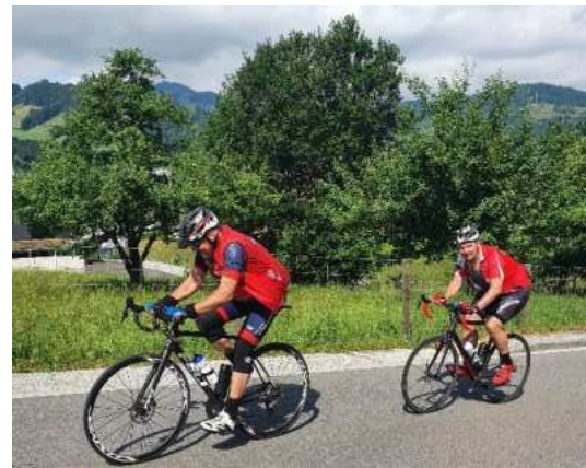
Auf und ab...auf und ab... :)