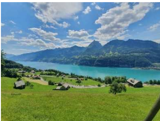
Abfahrt nach Amden / Weesen