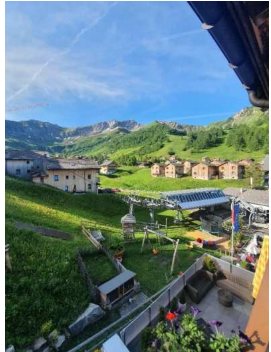
Am Morgen danach - traumhaft!