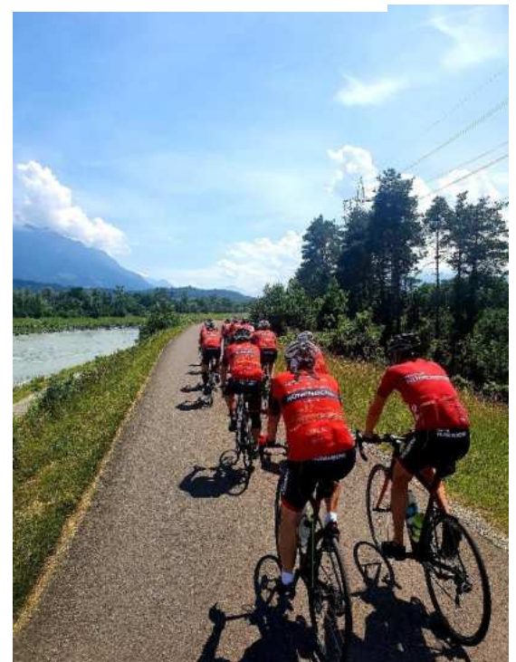
Entlang am Rheindamm