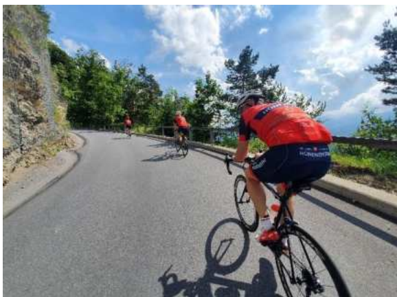
*Sternenfahrt" hinauf nach Malbun