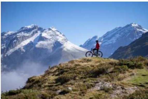
Biken - Hotel Crystal Engelberg